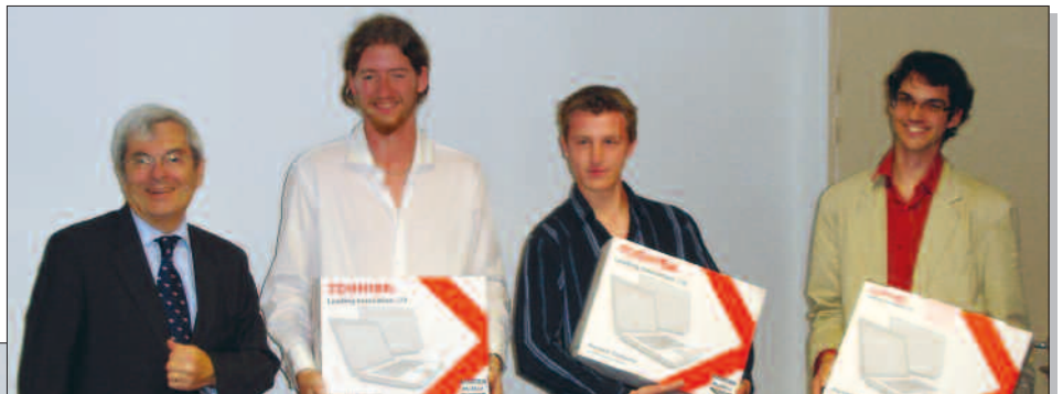
↑ Les gagnants de l'INSA Rennes.