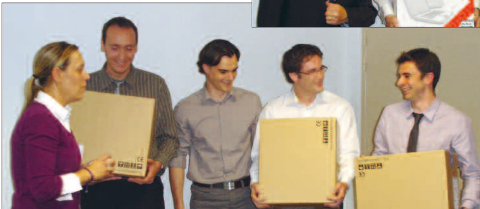
← Sur la deuxième marche du podium.